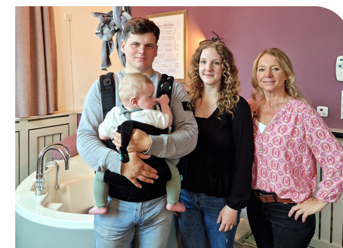
Nun fast ein Jahr später zog es die Familie wieder ins MARIEN zu Dreharbeiten mit dem WDR und um dem Team „Hallo“ zu sagen.

Jetzt – ein Jahr nach der Eröffnung – sind bereits zahlreiche Babys im Hebammenkreißaal auf die Welt gekommen und die Nachfrage ist hoch. Der Chefarzt der Klinik für Gynäkologie und Geburtshilfe